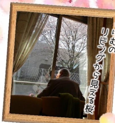
じゅげむのリビングから見える桜

大切な時間、瞬間を共に過ごさせていただけるように、これからも、ひとりひとりの「心の声」を丁寧にひとつずつすくい、応えていきたいと想います。