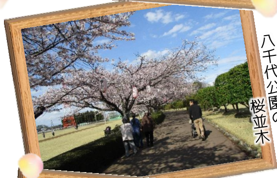
八千代公園の桜並木