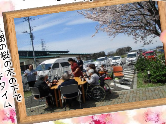
玉樹の桜の木の下でランチタイム