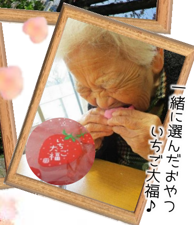
一緒に選んだおやついちご大福♪